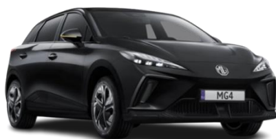
Pebble ČRNA (kovinska) 500,00 €