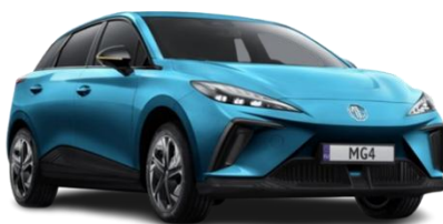
Brighton MODRA (kovinska) 500,00 €