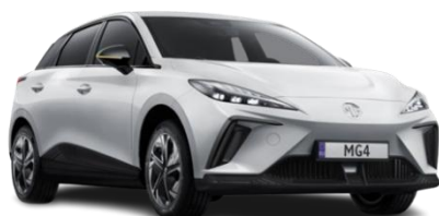
Dover BELA (enoslojna) 0,00 €

**Ob nakupu novega vozila MG4 EV, dobite zraven tudi brezplačno polnilno postajo in V2L kabel