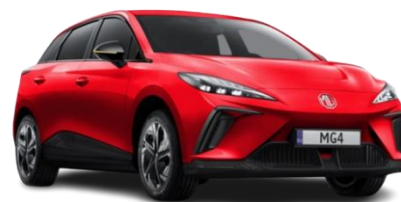
Diamond RDEČA (kovinska) 500,00 €