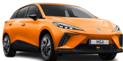
Fizzy ORANŽNA (kovinska) 500,00 €