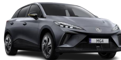
Andes Siva (kovinska) 500,00 €